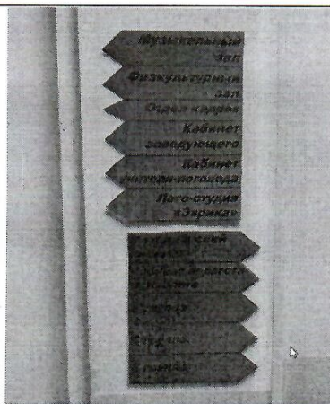
До (40 минут)